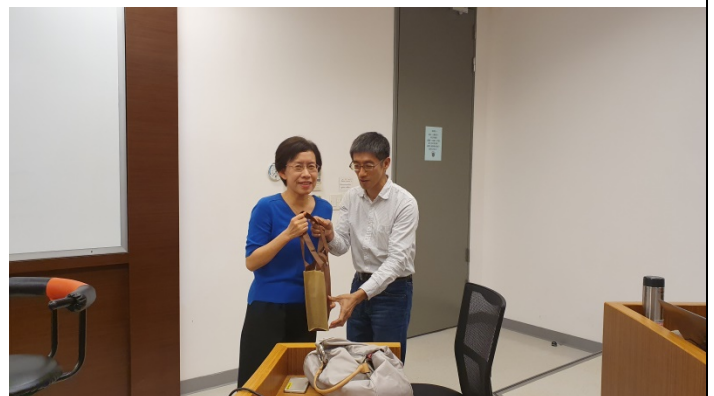
主辦單位曾堯民組長致贈禮物